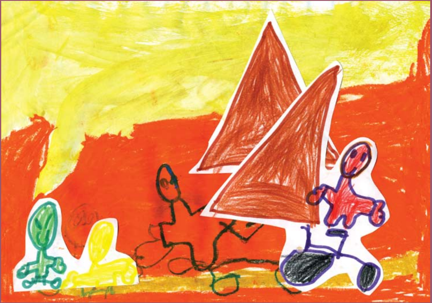
Título: Los amigos se prestan sus bicis en el monte