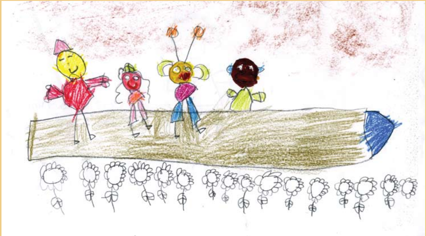
Título: Niños viajando al espacio en una nave espacial